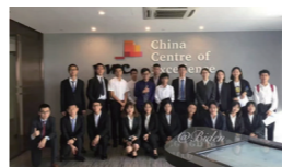
四大/券商/投行/核心业务