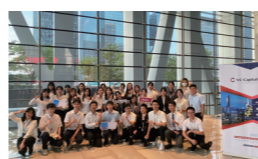
一级市场实习经历

孵化器产业涵盖科技、金融、智能硬件、资讯、文化、建筑等各大领域，配套基金实习日将由导师带领熟悉IPO等资本运作理念与流程，一级市场逻辑，金融建模，上市公司估值，杠杆收购，公司金融。（此模块为线下实地项目特设，额外两天，可选择）